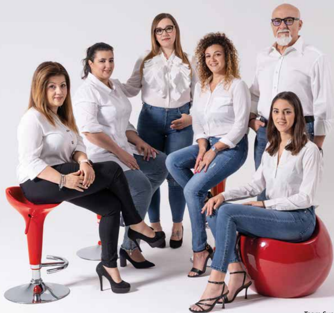
Team Supporto Clienti

In Dacom sono 15 le persone dedicate alla customer care: ogni domanda su un ordine o una spedizione e ogni modifica che un cliente voglia apportare viene presa in carico e gestita da un assistente preparato e in possesso di tutte le informazioni necessarie. Un supporto costante, puntuale e attento.