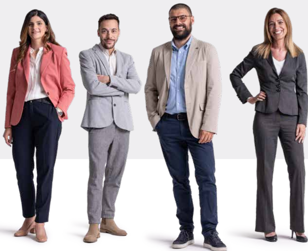
Team Purchasing Office